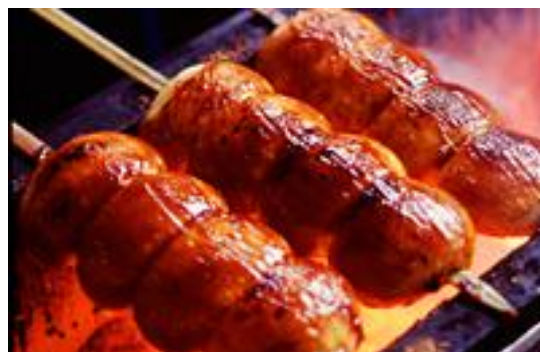
烤饅頭(白饅頭塗上味噌黃醬用火烤)